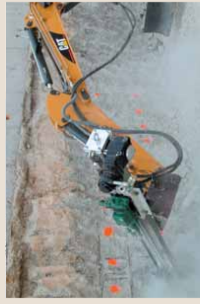
Applicazione pratica su mini escavatore. Application on mini excavator.

Predisposta sia per martello fondo foro che per perforatrice, la slitta SPEEDYDRILL è concepita per essere montata semplicemente e velocemente su qualsiasi struttura in tubi innocenti o su apposite culle. E' inoltre possibile l'installazione della versione idraulica su mini escavatori.