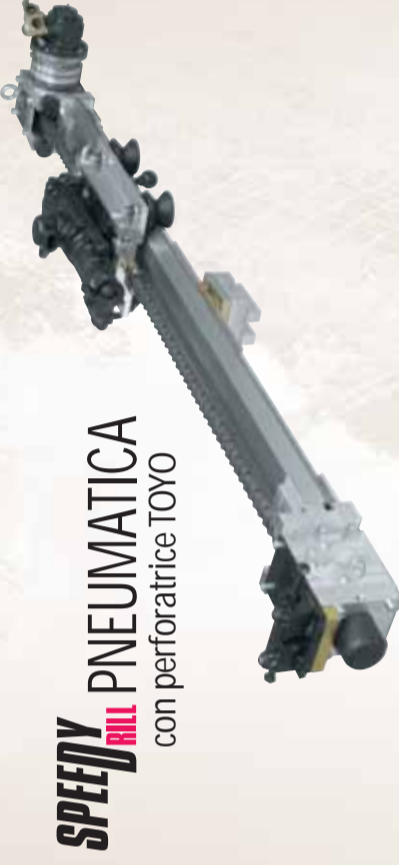
SPEEDYDRILL PNEUMATICA con perforatrice TOYO

Designed to use down the hole hammers and light drifters, SD has a quick and easy system to fix the mast to any scaffold or special tubular sledges. It is also possible to make special attachment for mini excavators and other special equipments.