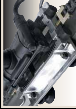
carrello ammortizzato anti vibration system with springs