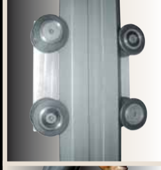
ruote del carrello regolabili easy regulation of the wheels