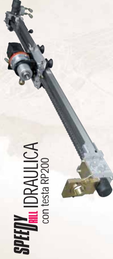
SPEEDYDRILL IDRAULICA con testa RP200