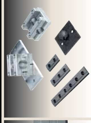
accessori (ralla, attacco tubi, etc.) accessories