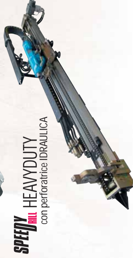
SPEEDYDRILL HEAVYDUTY con perforatrice IDRAULICA